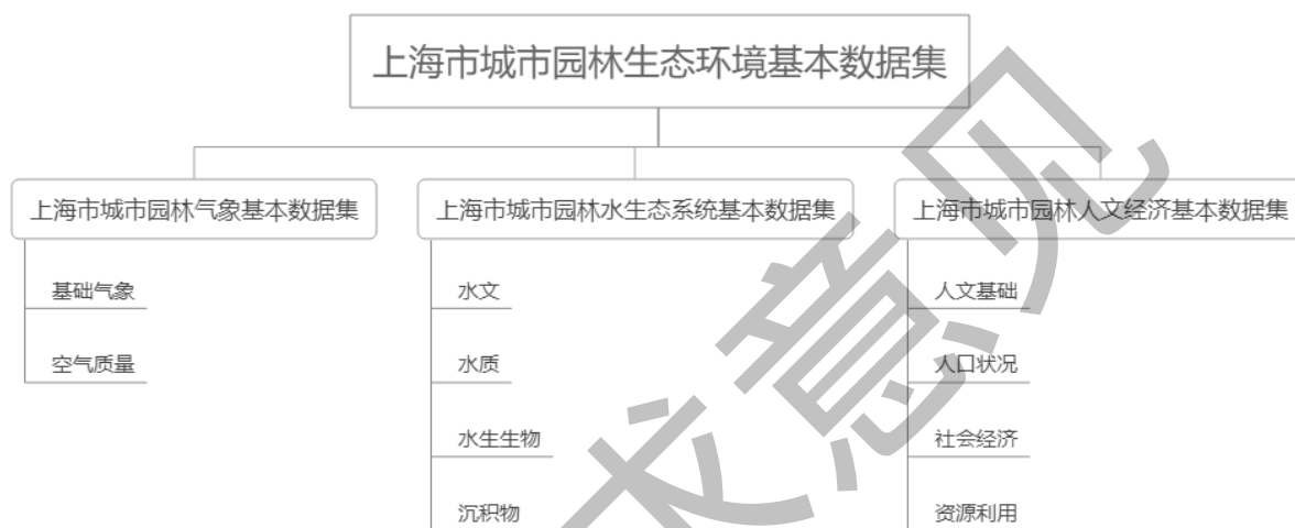
图2 城市园林生态环境基本数据集分类示例——属性分类法

属性分类法应根据数据之间的包含、相斥等关系，构建独有、共用属性，宜适用于具有少量数据元的基本数据集编制分类。城市园林生态环境基本数据集分类示例——属性分类法参见图2，“气象”包含“基础气象”和“空气质量”，“水生态系统”包含“水文”、“水质”、“水生生物”、“沉积物”，“人文经济”包含“基础数据”、“人口状况”、“社会经济”、“资源利用”。标题设置应符合本标准中4.2.1.1内容的标题设置要求。